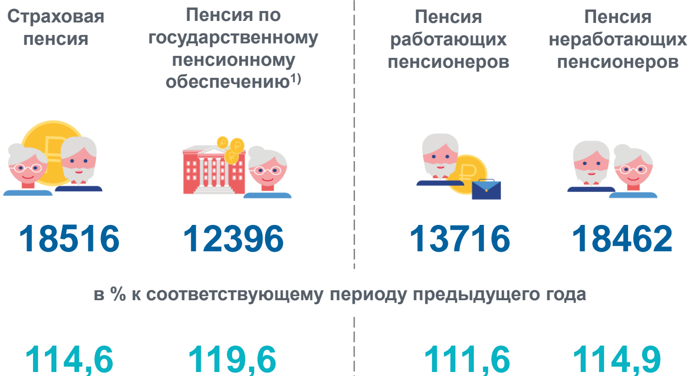
Средний размер назначенных пенсий