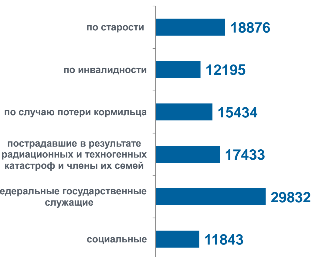
Средний размер назначенных пенсий в % к соответствующему периоду предыдущего года